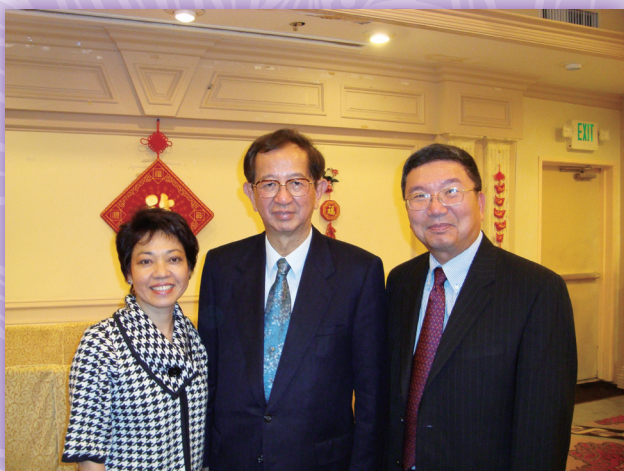
▲2009年邀請李遠哲博士來洛杉磯做專題演講

高中時代，化學、生物是最感興趣的科目，農化系自然成為選擇的科系，中興農化系土壤肥料組就是自己優先選擇的科系之一。沒有了高中時代學校嚴格的限制，大學