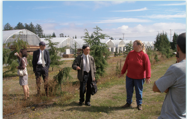
率同仁考察加拿大種子園

2009年承蒙母校抬愛，獲選為國立中興大學第13屆傑出校友，實惶恐而不敢當，為延續母校之優良傳統與校譽，自當加倍努力，除在專業領域為民眾謀取最高福祉外，更將致力於培育人才、提攜後進，以使母校之影響力永續長存！