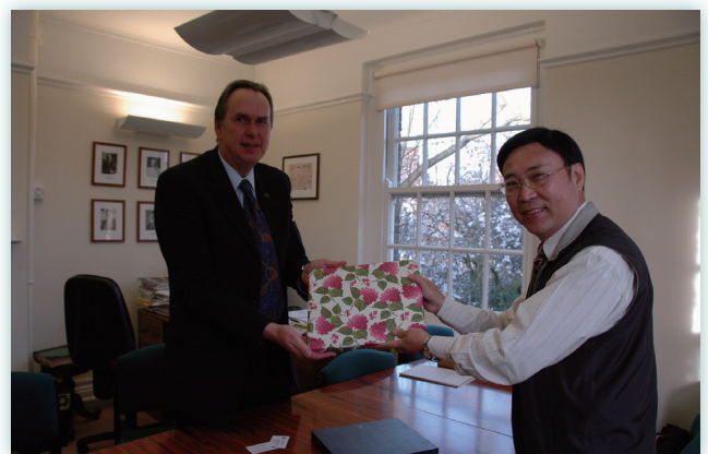
拜訪英國皇家植物園園長

2004年1月，農委會組織改組成立科技處，奉派出任首任處長，全力推動農業科技化、科技產業化的工作，順應二十一世紀生物經濟時代的挑戰，協助台灣農業轉型升級。