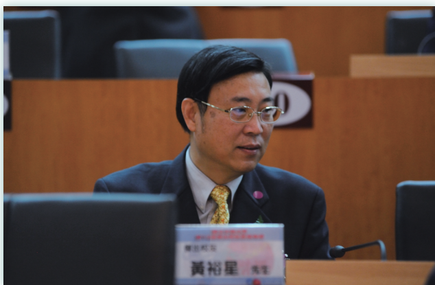
黃校友出席參加傑出校友頒獎典禮