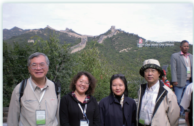
率團赴北京參加APFNet會議