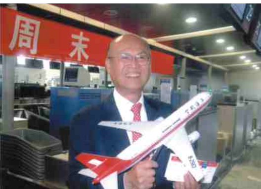
兩岸直航包機首航紀念

再一次的感謝母校給我傑出校友的榮譽，也覺得今後自己應該多做事來回饋母校，回饋社會。目前我兼職負責上海台商協會，敬請各位老師，學長，同學們如有機會來上海，請事先告知，讓我有機會在上海為大家服務，再一次地謝謝大家。