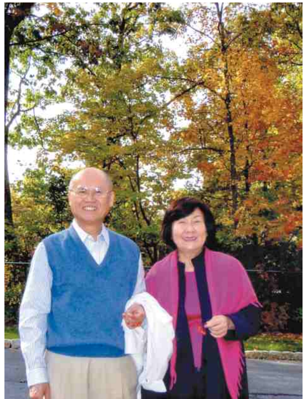
伉儷情深、相偕旅遊

教了第一章，第二章而已，因此，恰好可以利用擔任3年的小學老師時，利用晚上的時間到台南市補習班補習，雖然很辛苦，但最後總算很幸運的進入中興大學。