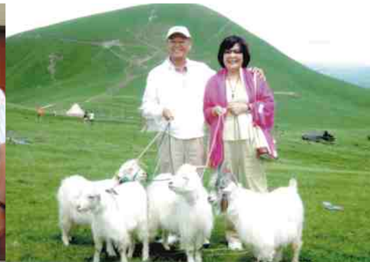
新疆大草原牧羊人