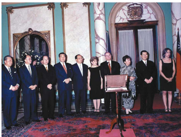
▲88年1月陪同院長訪問多明尼加參加總統國宴時與行政院閣員合影

個人辭職的舉動，引發媒體及大眾的關注與共鳴，雖無法力挽狂瀾，但也因此造成行政部門在訂立新的農發條例修正案，對興建農舍以較嚴謹的態度，做出有條件的限制，立法院再審議此法