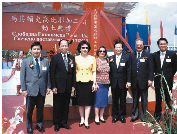
▲88年8月陪同蕭院長訪問馬其頓時與行政院閣員合影

在東坡先生的眼裡，世上沒有壞人也很少恨別人，但一有不滿卻必一吐而後快。東坡先生一生堅持真理，從來不因自己的利益或輿論的潮流而改變方向，直言敢諫，勇於批判。他活在糾紛迭起的時代，難免變成政治風暴的海燕。東坡先生仁慈慷慨、不知道如何照顧自己的利益，對同袍的福祉倒非常關心，老是省不下一文錢，卻自覺和帝王一樣富有。對人世，他有佛家不沾著的灑脫。膾炙人口的前後「赤壁賦」，充分道出其揮灑的人生觀。