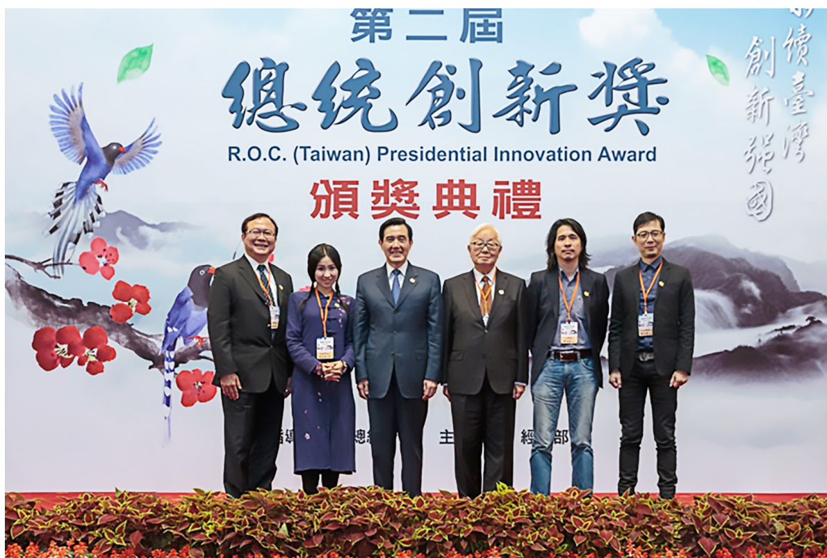
獲頒第 2 屆總統創新獎

在財政部服務期間，我們從關懷民眾的需求出發，運用數位科技，改善作業流程，積極推動扣除額單據電子化、綜所稅試算、電子發票、賦稅資訊再造等創新服務。報稅部分，以使用者（納稅人）為中心翻轉報稅流程，主動蒐整串接個人財稅資料，設計一鍵計算稅額功能，獲得國人讚許；「電子發票」不僅有利消費者記錄消費軌跡、自動兌獎，也為業者保留更完整商品銷售數據，利於進一步分析運用。這些變革，更減少了紙張運用和不必要的往返交通耗能，一步一腳印下來，我們讓政府機關能夠在業務推動、環境永續及民眾感受之間創造多贏。