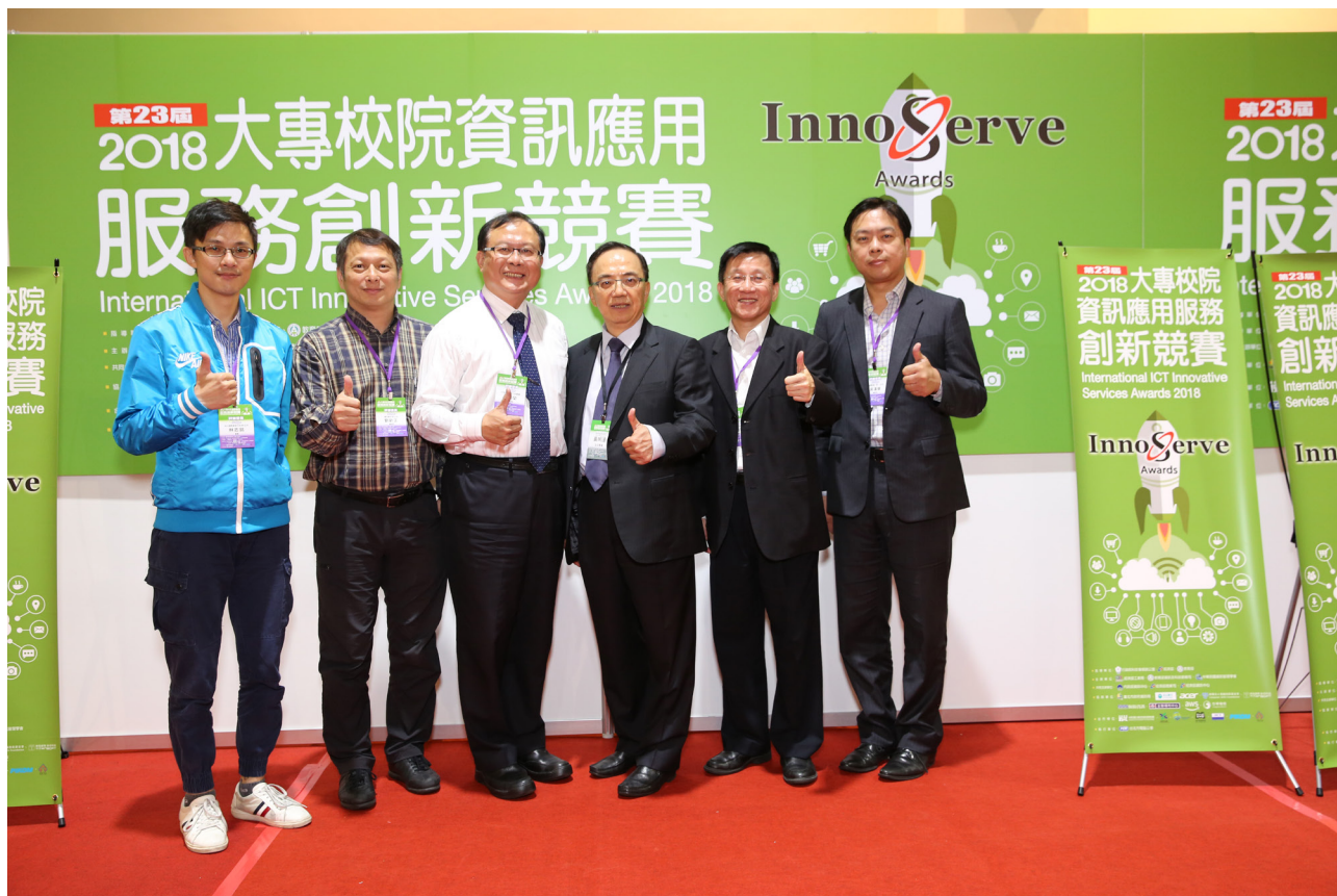
2018 資訊服務創新競賽

在 105 年 5 月到任行政院人事行政總處後，帶著相同的理念，基於善用數位科技、促進政府人力資源永續，我和同仁一起推動了許多人事變革，其中包括：