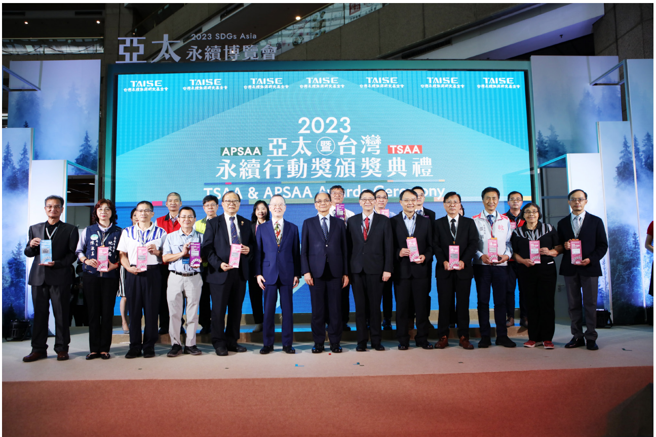
獲頒 2023 第三屆「TSAA 臺灣永續行動獎」金獎

我們在人事總處的變革，一直呼應著政府「2050 淨零排放」，聚焦「營造友善職場」、「培育優質人力」及「人事數位轉型」，這些數位轉型和永續行動的成果，讓我們獲得 2023 第三屆「TSAA 臺灣永續行動獎」永續發展金獎的肯定；所屬公務人力發展學院也因此獲得國際培訓總會 IFTDO「2024 年全球人力資源發展獎」，且為臺灣唯一獲獎機關，肯定我們一直以來的努力和耕耘。