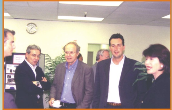
BMW科技主管參觀愛勝科技公司

在美國的空軍、陸軍、太空總署、歐洲的空中巴士他們邀請我演講，沒有一次能夠使我像今天這麼緊張、這麼興奮、心中充滿這麼多感恩，剛剛看到學弟學妹們精彩的熱門舞蹈表演，心裡真的好開心，因為我看到中興大學的活力，中興大學的朝氣。上回我來惠蓀堂是廿四年以前，同台上的學弟學妹們一樣，我也是來跳舞的，那年我大二，只是沒有像學弟學妹們這樣的膽識，我們不敢在台上跳，只敢在台下跳，或是人群裡面跳。轉眼廿四年過去了，想和學弟學妹分享的實在太多，其中影響我深遠的，正是剛剛台上學弟學妹們所展現出來的自信和膽識，如何擁有這份自信和膽識，當初我在景美女中第一個志願是森林系，那年我大姐從國外回來，好多年不見，知道我要填森林