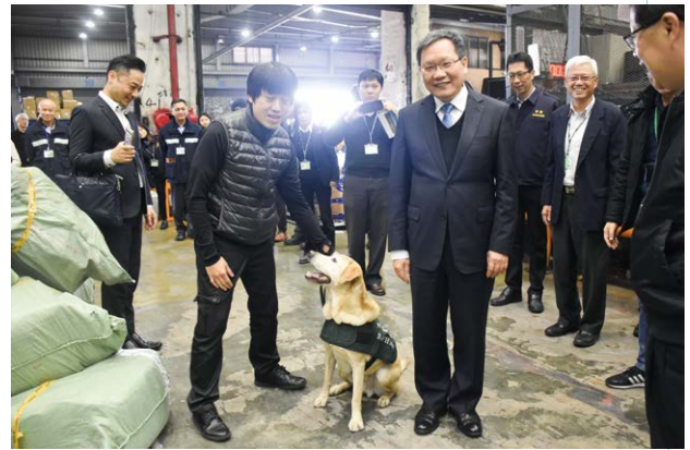
視察海關緝毒業務

每個人在不同人生階段，可能都有對未來的規劃與目標，但在通往目標的道路上，經常充滿變數，計畫永遠趕不上變化，也許會帶來挫折感，但也因此更加豐富與精采我們的人生。猶記在學校執教鞭的那段日子，我以為教書應該是這輩子的唯一職業，但2014年12月出現不同人生選項，幾經考量，我認為身為財政學者，不能老是待在學術圈，應該到實務界歷練，方能結合理論與實務。從學術界踏入公部門，已預知這條路將比以往的任何工作都要困難，仍毅然做此人生重大抉擇，暫時離開最愛的教學與研究工作，至臺北市政府擔任財政局局長一職。