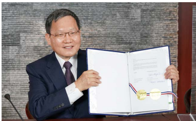
簽署中美洲銀行 (CABEI) 在臺灣設立國家辦事處協定