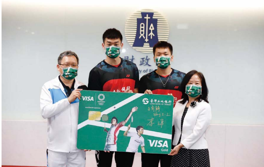
慰勉土銀羽球隊麟洋配奪金

長用於還債，在第一年就為臺北市政府創下減債新臺幣 160 億元的紀錄，大幅改善市府債務負擔。