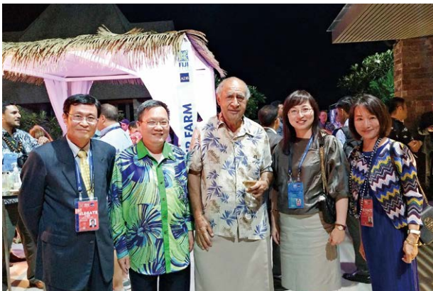
參加亞洲開發銀行 (ADB) 年會

韶光荏苒，回想在母校求學時期，竟已是將近四十年前的往事！在那段時間結識了諸多志同道合好友，大家一起在經濟研究的道路上相互切磋，留下許多美好回