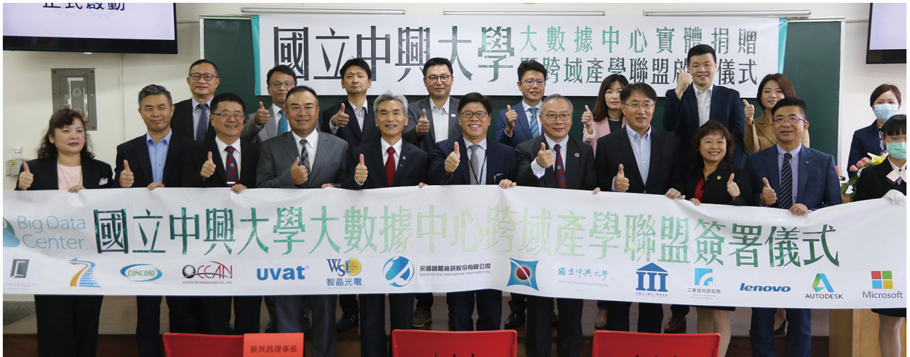
2020 年大數據中心啟動跨域產學聯盟助產業數位轉型

據人才(三)強化跨域應用厚實整體競爭力(四)協助產業進行數位轉型並提升企業價值，期許成為台灣產業在大數據發展與應用的重要推手。