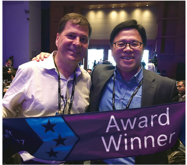
2017 年榮獲【微軟年度最佳國家合作夥伴】獎項