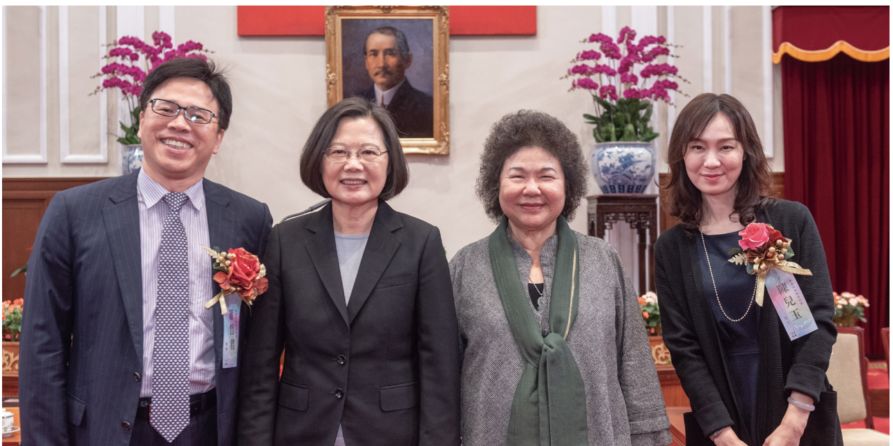
2018 年榮獲第 41 屆創業楷模獎

人才的培育是企業永續的基石，為提供員工舒適的工作環境，激發創意和潛能，采威於 2019 年投資新台幣 4 億元在台中水滴經貿園區規劃興建企業總部，總部 2 樓更特別設置為新創育成中心，打造成為新創團隊的孵化器，培育台灣智慧化應用新世代人才；2020 年捐贈 250 萬元回饋母校聯合建置「大數據中心」，主要推動產學合作與人才培育，只要是對大數據分析與雲端應用有興趣，同時想提前規畫未來職涯的人才，都可以到中心參加相關課程以及技能的訓練養成。中心希望實現的四大面向：（一）縮小學用落差（二）培育產業亟需的大數