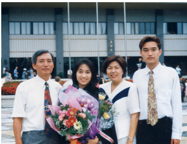
中興大學學士畢業典禮與爸媽弟弟合影

感謝父母的栽培、教育與養育之恩，且是我永遠的後盾。從小有父母、外婆和弟弟給我滿滿的愛，在我人生的每一個階段給我支持與鼓勵。爸爸、媽媽給予我的教導，豐富的學習與生活經驗，是跟著我一輩子的財富，也是讓我看世界的起始點與開拓視野的動力。