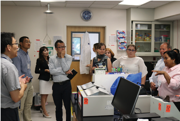
帶領團隊主辦研討會 - 企業代表參觀成果發表現場

還要感謝在我成長的每一個階段，給我幫助、提攜、信任、支持，亦或是磨練我的人。每一個走過的關卡，通過的挑戰，都豐富了我的經驗與人生。