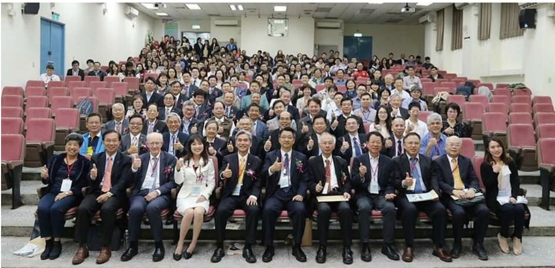
參加台灣食品科學技術學會的年會