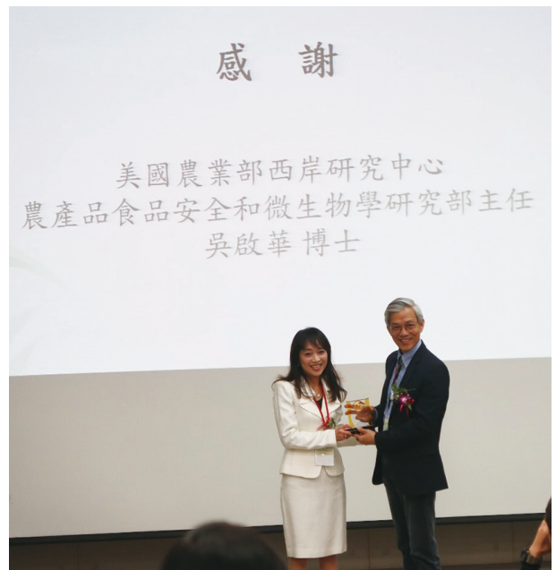
受邀擔任台灣食科學會年會的keynote speaker