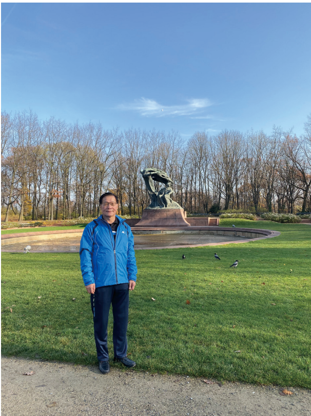
出訪波蘭，順遊皇家浴場公園

很多人都問我，你對園藝沒有興趣，怎麼有辦法念好？我都會說，如果「讀書」是你的選擇，那「學生」就是你選擇要扮演的角色。就算你發現可能不是那麼有興趣，但只要認真面對，一定會找到方法做好。認清責任之所以重要，是因為當你放下「我好討厭這門科目」的抱怨心，才有辦法靜下心看見怎麼轉變自己未來的可能性，才能設定新的目標，讓那個目標帶你往前走。