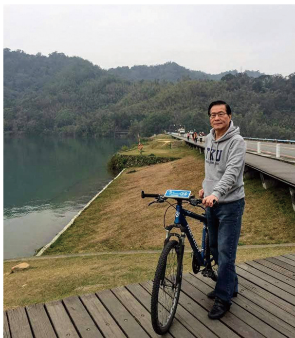
日月潭環潭自行車道騎行

究上精進，不僅是我所專長的資料探勘，在物聯網、人工智慧及臨床醫學資訊系統都有相當不錯的成果。