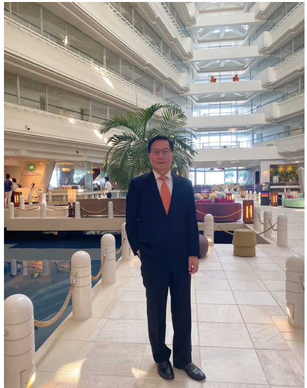
攝於日本沖繩喜來登酒店

被譽為是 20 世紀最偉大的成功學大師戴爾·卡內基 (Dale Carnegie) 曾說過：「多數人都擁有自己不了解的能力和機會，但都有可能做到未曾夢想的事情。」我也以此期許母校的學弟妹們，認清責任，設定目標往前走，讀好本科，幫自己創造更多機會，創造新的契機。