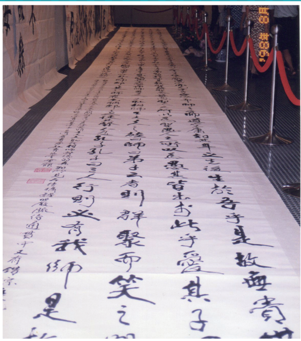
八樓高大作贈中國書法博物館