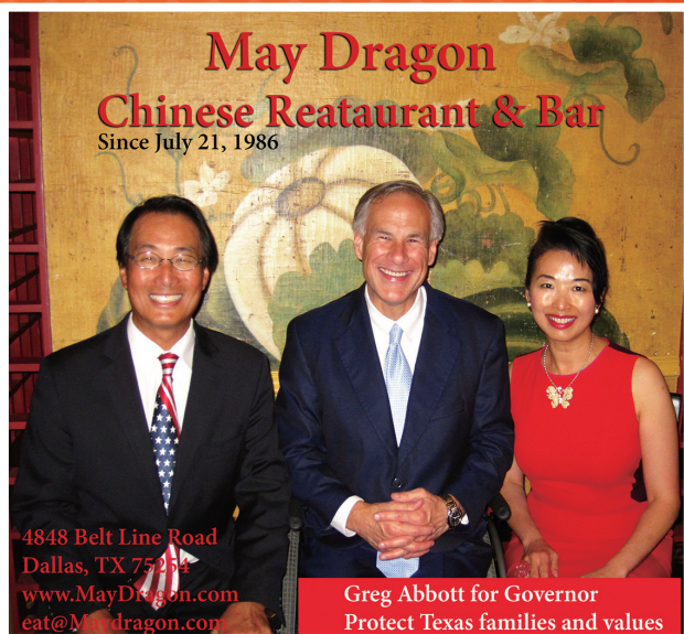
Greg Abbott for Governor Protect Texas families and values