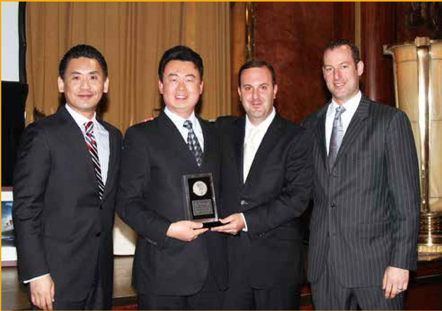
當選美國 AXA 年度最佳經理