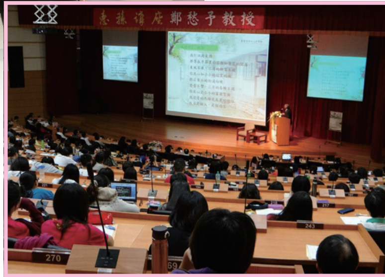
當日吸引500多位聽眾到場一睹大師風采