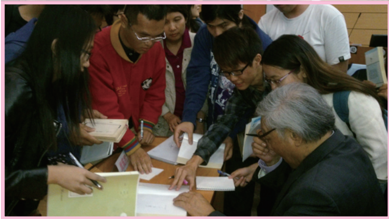
會後，大批學生索取簽名