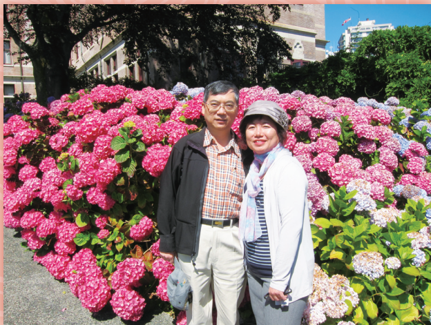
▼99年夏天攝於美國洛杉磯植物園