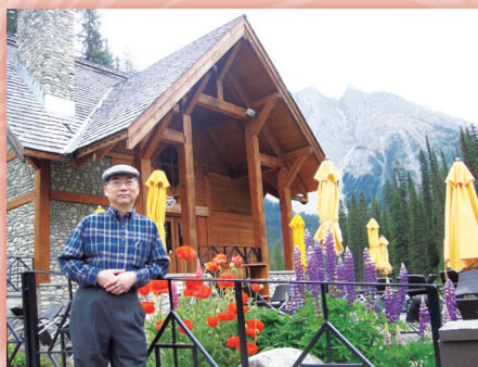
▼99年夏天攝於加拿大洛磯山區