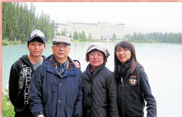
▲99年7月全家攝於加拿大

近幾年投入區域的實務課題，把所學及發現的理念，貫徹於各項課題的解決方案中，並相信解決問題的更深一層目的，是開啟創新的機會。創意之外需結合資源與切身投入，執行方案方可具核心意涵，這種融入社會議題的努力是執著且自然的，永續性及負責任的態度若能及於生活的各個層面，相信可對未來的挑戰充滿著信心與希望，吳教授如是深信，並以之為融入社會的切身感。