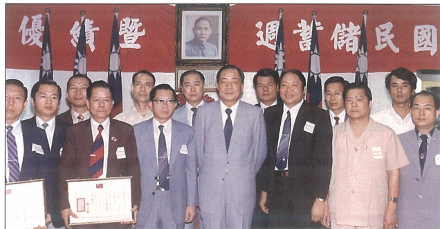
第十二屆國民儲蓄週暨優績表揚大會