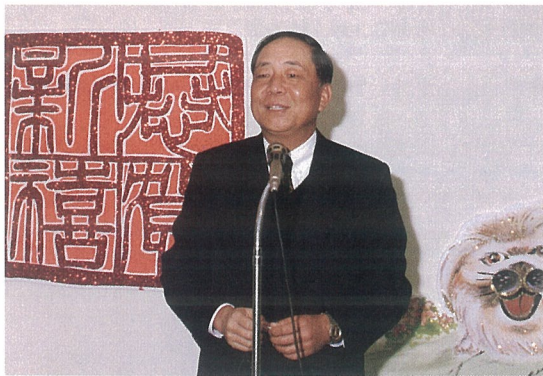
行政院退休人員春節聯誼會