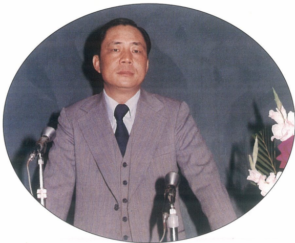
民國六十七年任財政廳廳長